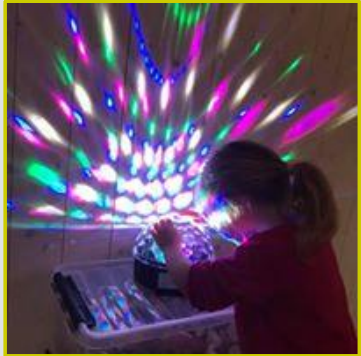
Et magisk sted for alle

Målet er at enhver morgen skal være lik for barna, samtidig som det er rom for personlige ulikheter. Poenget er at morgensituasjonene skal gi barna en trygghet og da må for eksempel avskjeden med foreldrene være lik uavhengig av hvem som er på jobb på morgenen. I tillegg må personalet bruke sin kjennskap til barna og danne gode relasjoner med alle barn